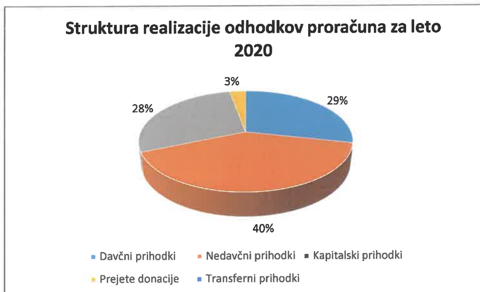
Graf: Struktura realizacije odhodkov proračuna za leto 2020

V strukturi odhodkov največji delež realizacije predstavljajo tekoči transferi (40%) sledijo investicijski odhodki (28%), tekoči odhodki (28%) in investicijski transferi (3%) celotnih načrtovanih odhodkov.